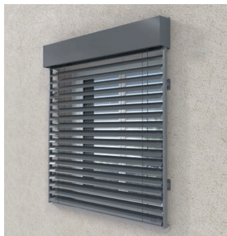
En applique avec lambrequin*