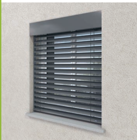
Entre tableau, sous linteau avec lambrequin*

Construction traditionnelle avec isolation par l'intérieur ou l'extérieur