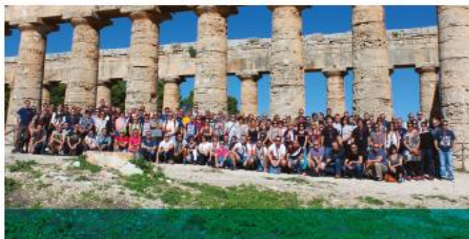
Sicile, octobre 2016, 150 salariés Profalux.

ENCE MAÎTRISE EXPERTISE SÉRIEUX AUTHENTICITÉ