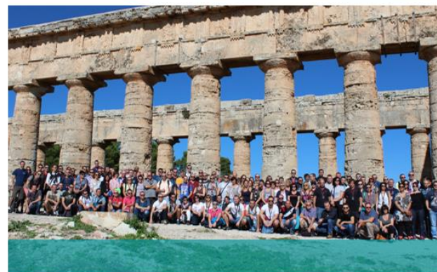
Sicile, octobre 2016, 150 salariés Profalux.